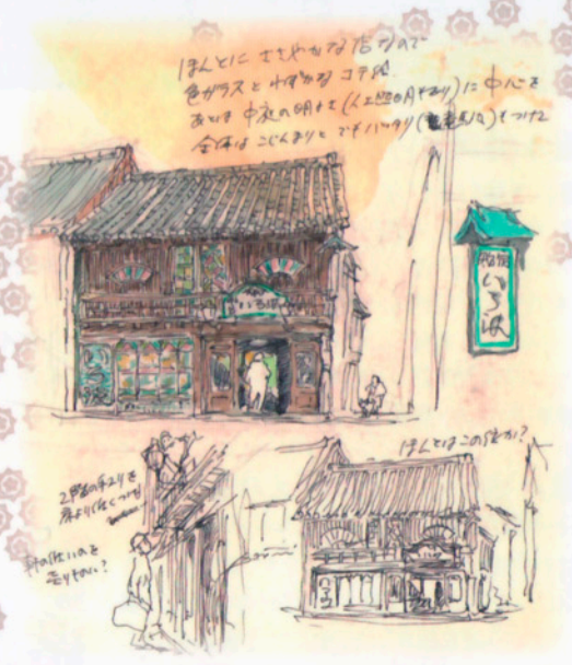
▲宮崎監督が描く御舟宿いろは