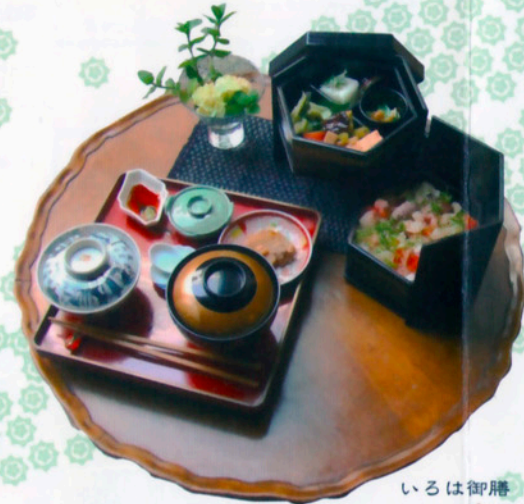
いろは御膳 (土・日昼のみ)