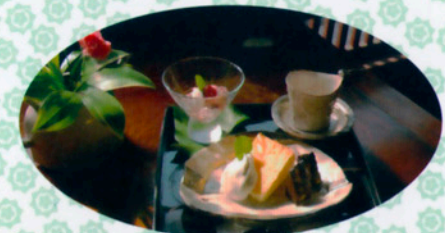
自家焙煎コーヒーと手作りケーキ