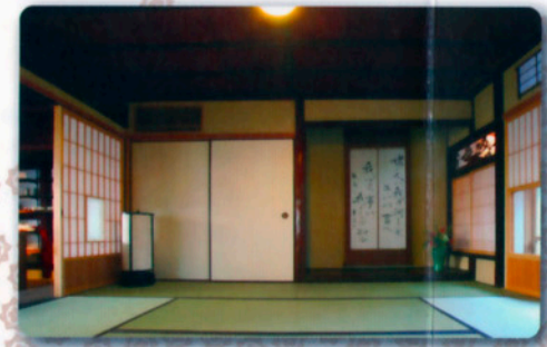
▲龍馬いろは丸事件談判の間