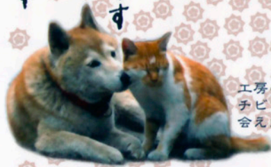
工房のマスコット チビとミニ 会えたらあなたに幸運が...